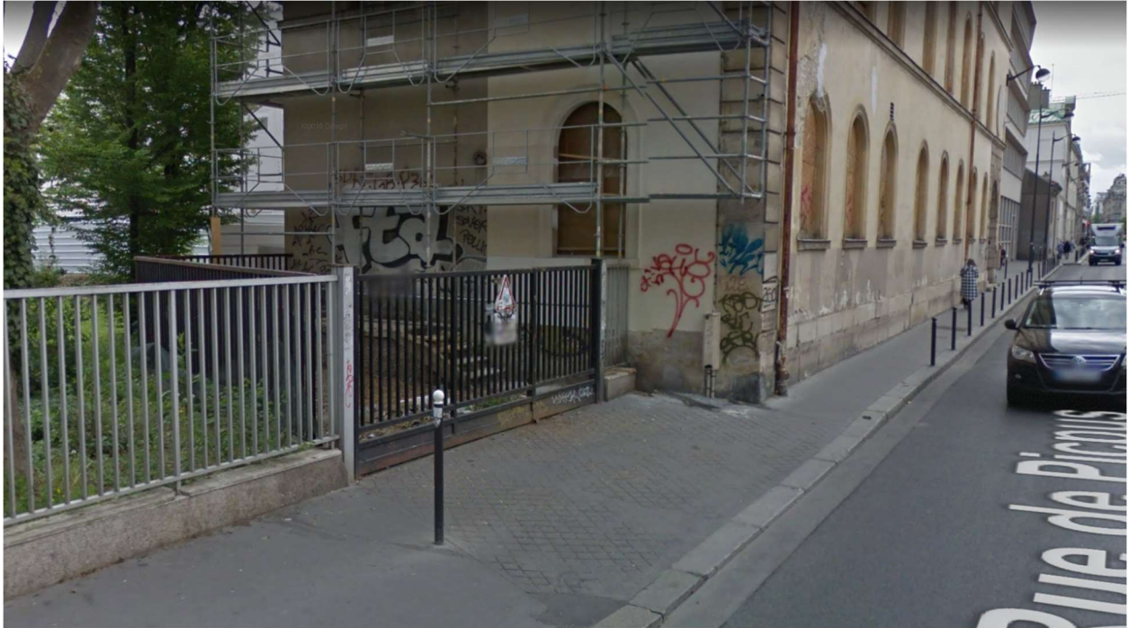
Rue de Picpus, Paris