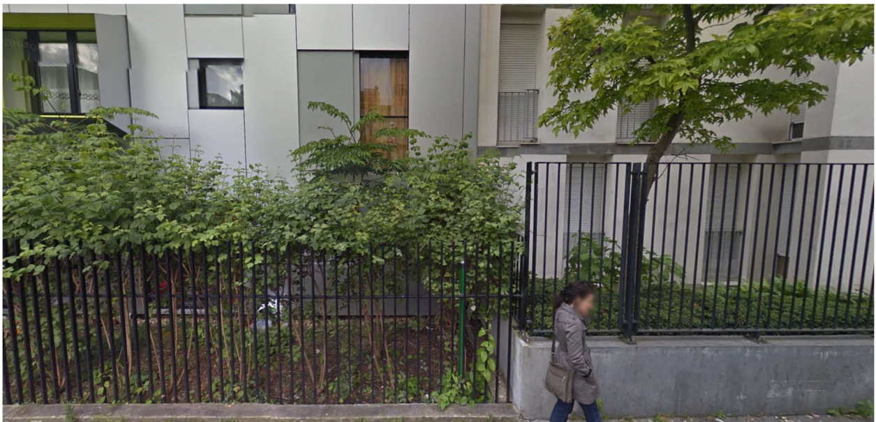
Rue Émile Duployé, Paris